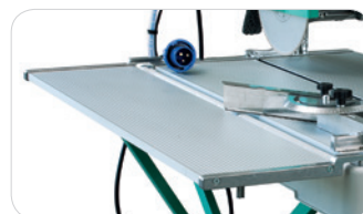
GRANDE CAPACITÉ DE COUPE