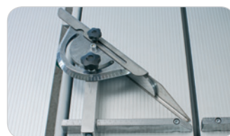
COUPE À 90°