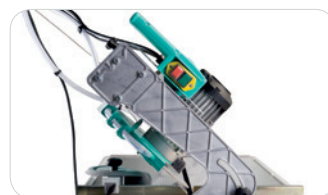
COUPE À 45°