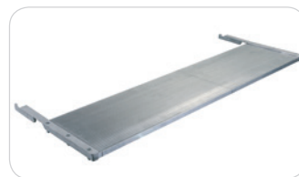
PLAN ADDITIONNEL EN OPTION