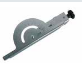
[ 3 ] Butée latérale avec graduation