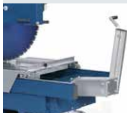
[ 1 ] DTS 1000 V