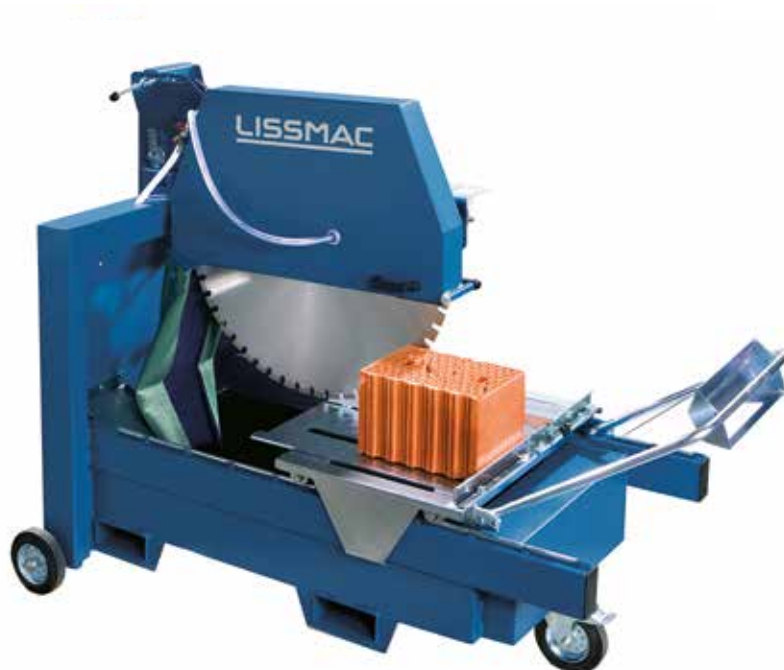
DTS 1000 H