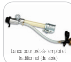
Lance pour prêt-à-l'emploi et traditionnel (de série)