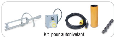
Kit pour autonivelant