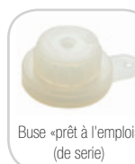
Buse «prêt à l'emploi» (de série)