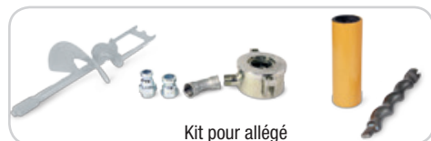
Kit pour allégé