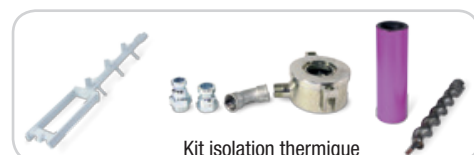
Kit isolation thermique