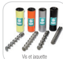
Vis et jaquette