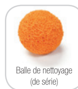
Balle de nettoyage (de série)