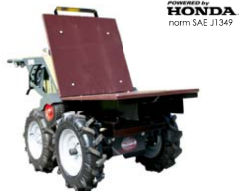
Plateau toujours inclus