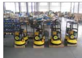
Monté en grande série