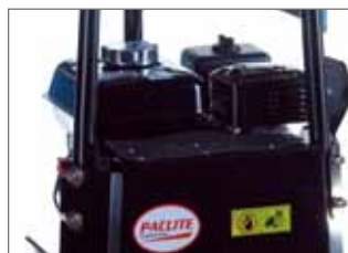
Capot de sécurité