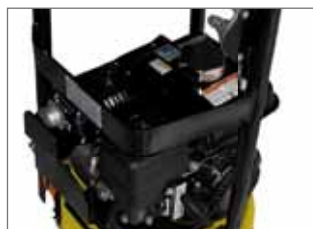
Cadre de protection