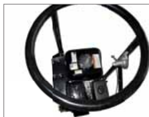
Accélérateur placé au centre sur la poignée