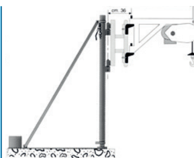
Avec élévateur à potence fixe et support pivotant

Kit étau pour AIRONE 300 NEW avec option conteneur contrepoids (Réf.03109121 + 03109122)