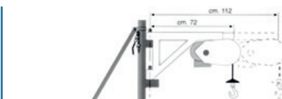
Avec élévateur à potence télescopique