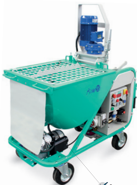
Tableau de commande électrique «inverter» exclusif IMER pour travailler même dans des conditions difficiles.